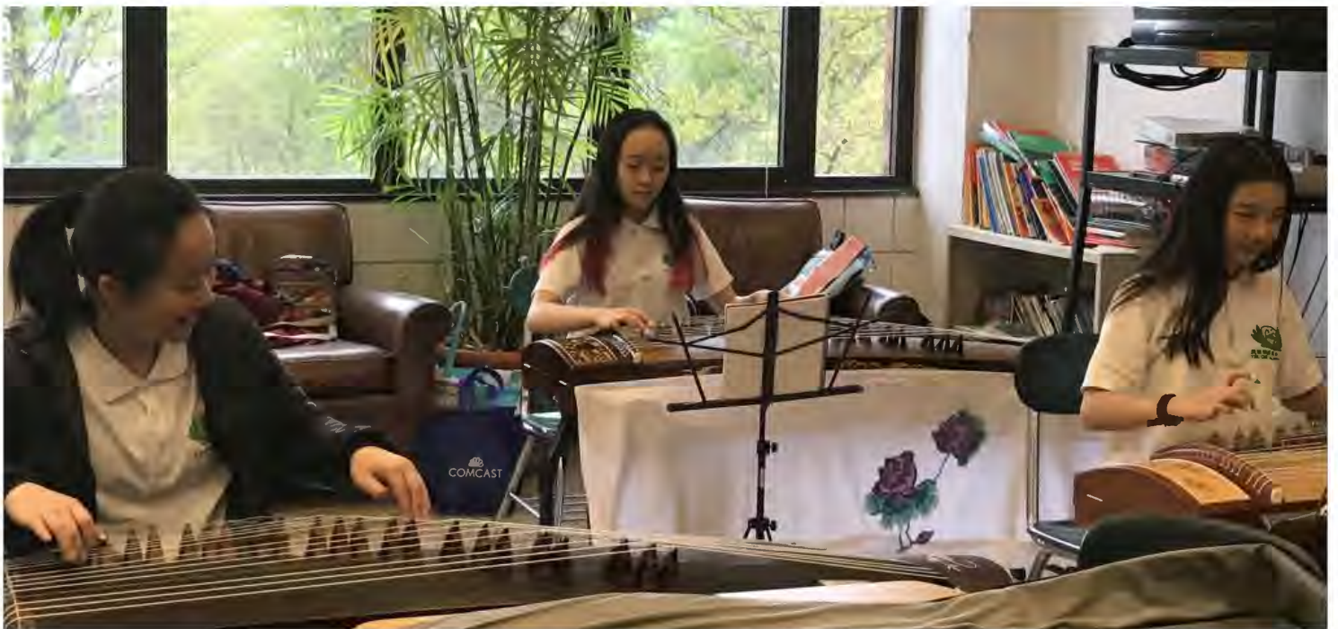
古箏班學生在教室練習 Guzheng class students practice in the classroom